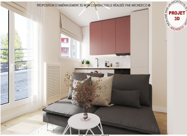
PROPOSITION D'AMÉNAGEMENT 3D NON CONTRACTUELLE RÉALISÉE PAR ARCHIDECO ©