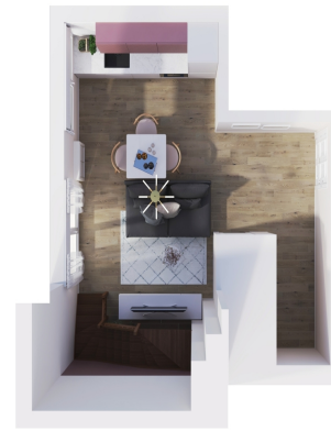
2025 - HOME STAGING VIRTUEL®