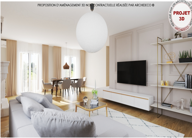
2024 - HOME STAGING VIRTUEL®