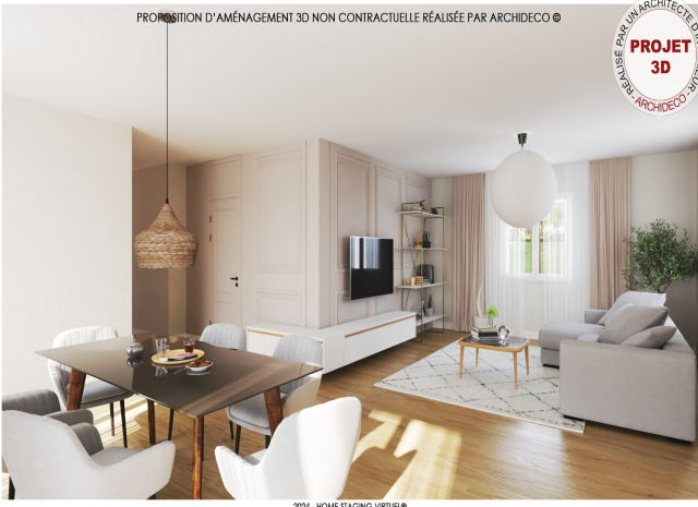
2024 - HOME STAGING VIRTUEL®